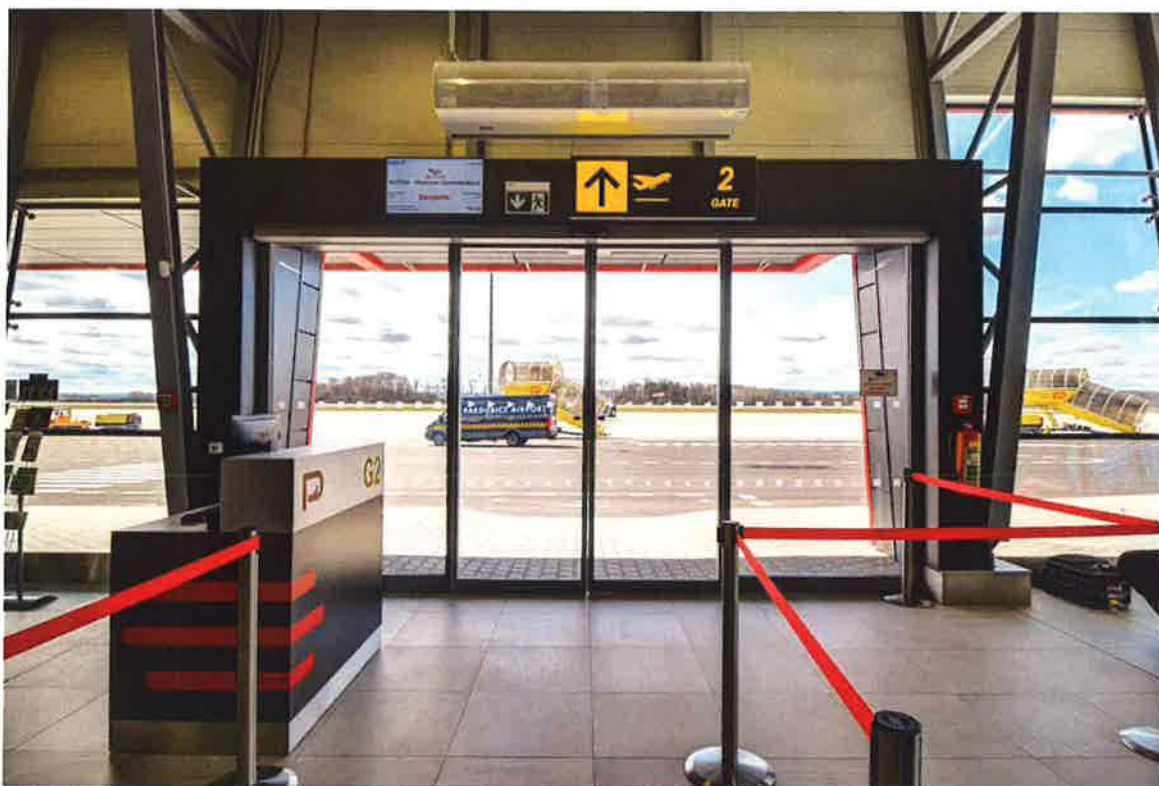
Letiště i obchodní domy – vzduchotechnika z 2VV slouží po celém světě.

Máme k tomu jedno z nejmodernějších pracovišť u nás a tým těch nejlepších specialistů. Aktivně spolupracujeme s odbornými instituty v oblasti vzduchotechniky, pravidelně vystavujeme na nejvýznamnějších oborových akcích, to vše s cílem čerpat aktuální trendy a navazovat nové kontakty.